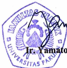
Ir. Yamato, MT.