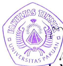
Ir. Yamato, MT.