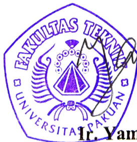
Ir. Yamato, MT