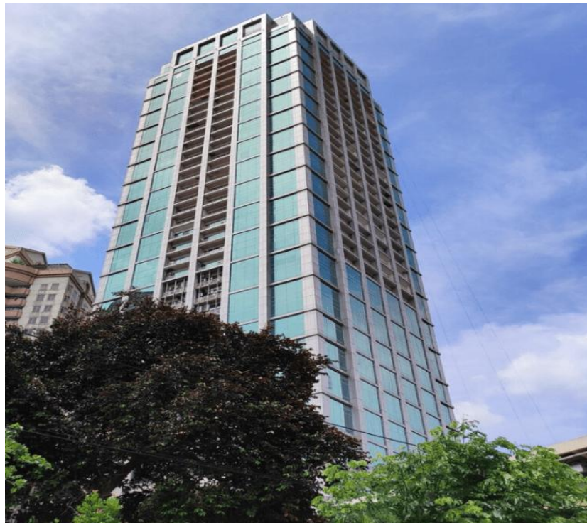
Gambar 2 Foto Perusahaan

Nama : PT. Artha Prima Finance Lokasi :Jalan Letjen S. Parman No. Kav 22-24 Grand Slipi Tower LT 32, RT.1/RW.4, Palmerah, Kec. Palmerah, Kota Jakarta Barat, Daerah Khusus Ibukota Jakarta 11480. Telepon : (021) 29022071 Whatsaap : 088975466131 Website : https://www.arthaprima.co.id/